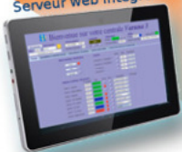
Serveur web intégré

Avec une disponibilité Panafricaine et une expertise avérée, ACS se présente comme l'acteur idéal de tous vos projets Domotiques.